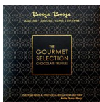
GOURMET SELECTION, 230g BB-06